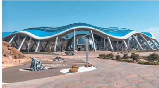
г. Владивосток Теплоноситель PROFi Eco 8 т.