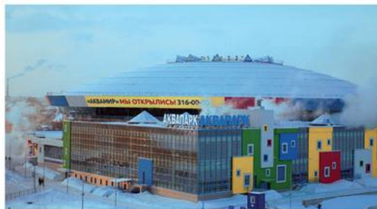
г. Новосибирск Теплоноситель PROFi Eco 12,6 т.