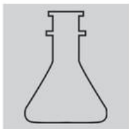
Моноэтиленгликоль, пропиленгликоль или глицерин