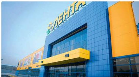
г. Томск Теплоноситель PROFi 19 т.