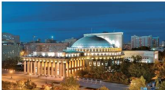
г. Новосибирск Теплоноситель PROFi Eco 8 т.